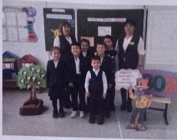
Учителя начальных классов проводили тематические классные часы. Учащиеся участвуют на линейках, конкурсах, спортивных соревнованиях.