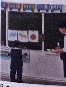
В феврале прошли открытые классные часы.